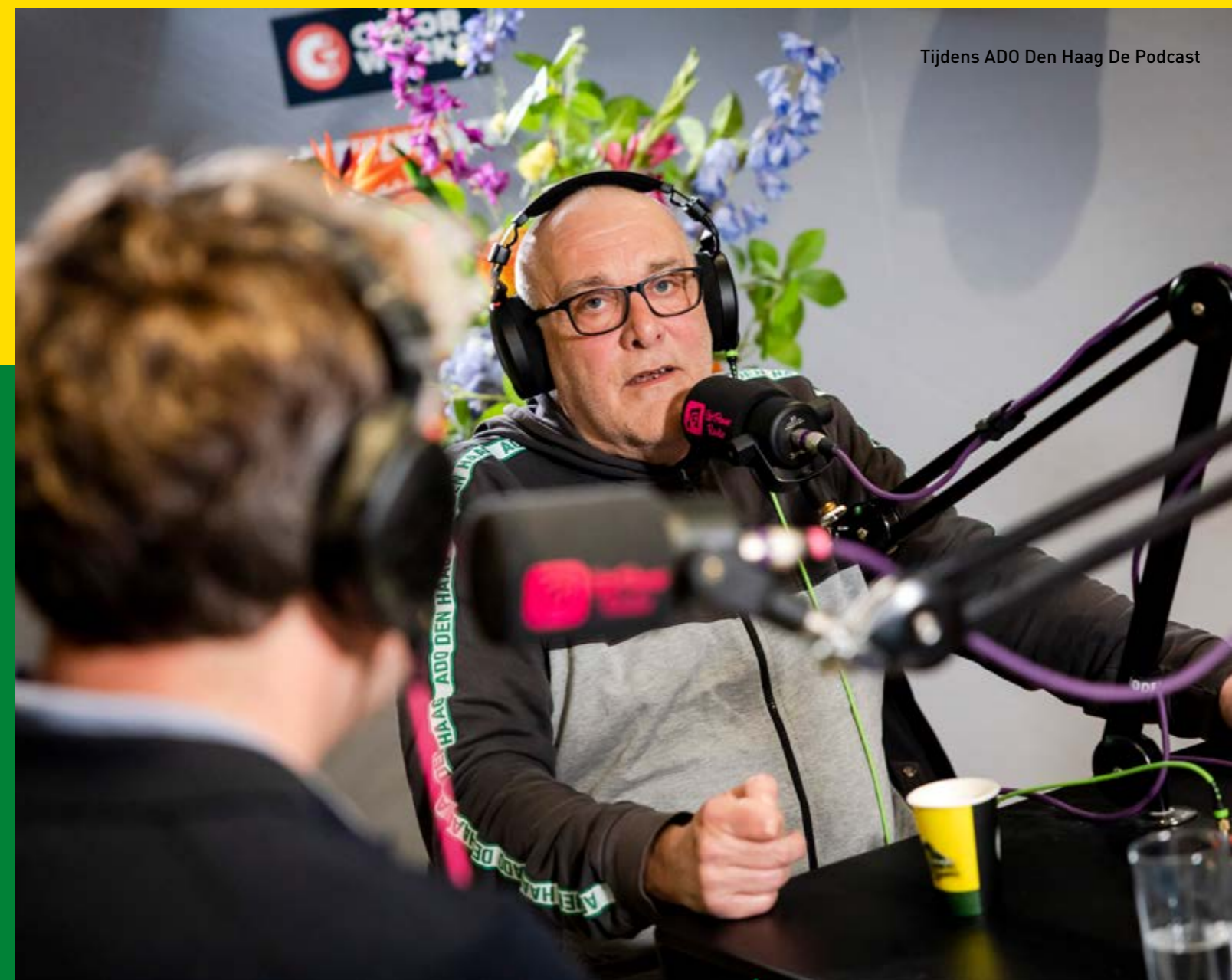
Tijdens ADO Den Haag De Podcast