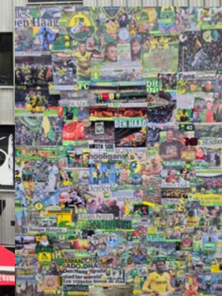
Alles wat met (ADO) Den Haag te maken heeft.