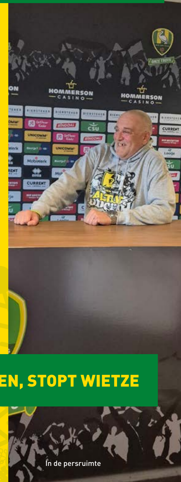
In de persruimte