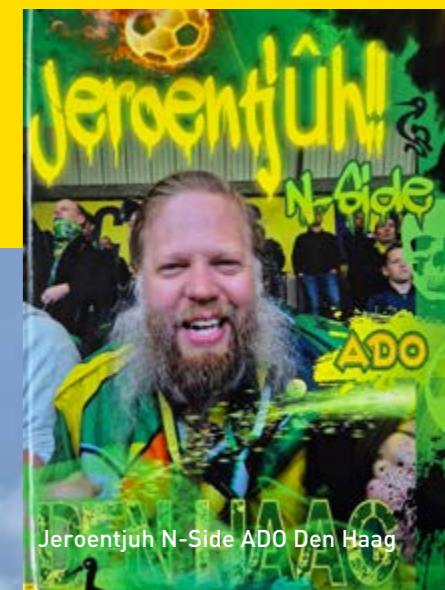
Jeroentjuh N-Side ADO Den Haag